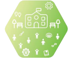
XI. Детски градини