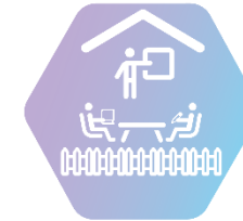
X. Грижа за ученика