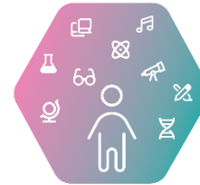
IX. STE(A)M и природни науки