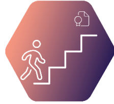
VIII. Учителско развитие