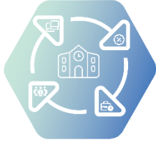
VII. Управление на образователните институции