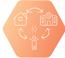
III. Училище и семейство