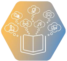
VI. Компетентностен подход и интердисциплинарно учене