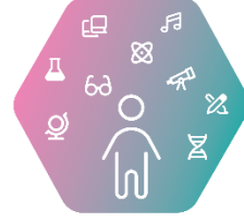
IX. STE(A)M и природни науки