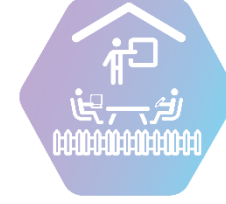
X. Грижа за ученика