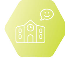
IV. Позитивна училищна среда и организационна култура