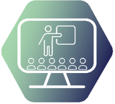
I. Дигитални компетентности