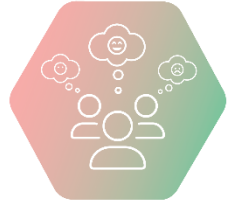
II. Социално-емоционално учене