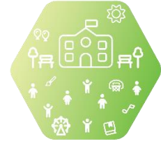
XI. Детски градини