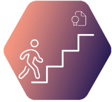
VIII. Учителско развитие