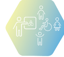
V. Приобщаващо образование